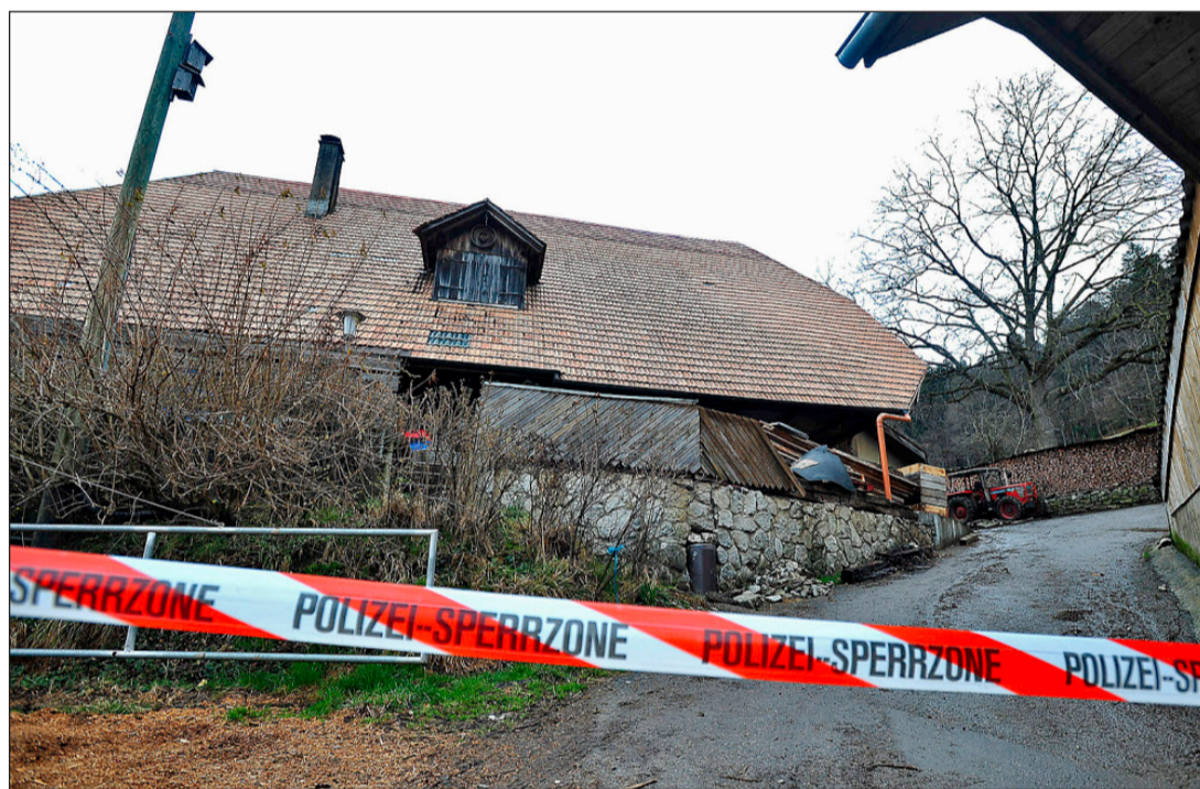
Von diesem Bauernhof im Oberaargau retteten die Polizei und der Veterinärdienst rund 50 Tiere. Der Bauer, der mit der Arbeit überfordert war, wird nun ärztlich betreut.

Dies ist bereits der vierte in diesem Jahr bekannt gewordene Fall eines Landwirts, der seine Tiere vernachlässigte. Begonnen hat die traurige Serie mit einem Landwirt aus Studen. Aus dessen Stall mussten 78 Tiere gerettet werden - für eine Kuh kam jede Hilfe zu spät. Die Polizei meldete wenige Tage später, dass ein Bauer in Signau sein Vieh verhungern und verdursten liess. Und schliesslich sprach in